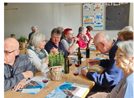
Gemütliches Beisammen sein