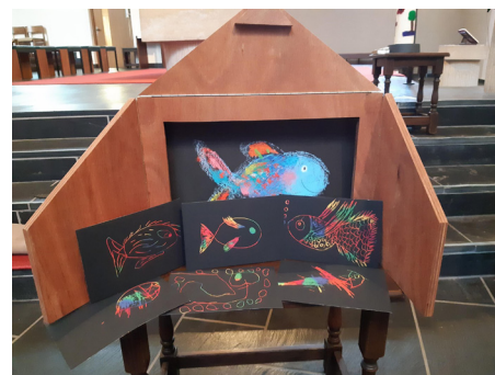
Die verschiedenen Stimmungsfische