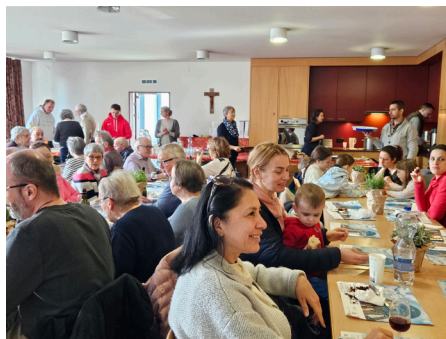
Im Don-Bosco-Haus