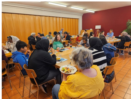
Hot Pot, ein Treffpunkt für alle